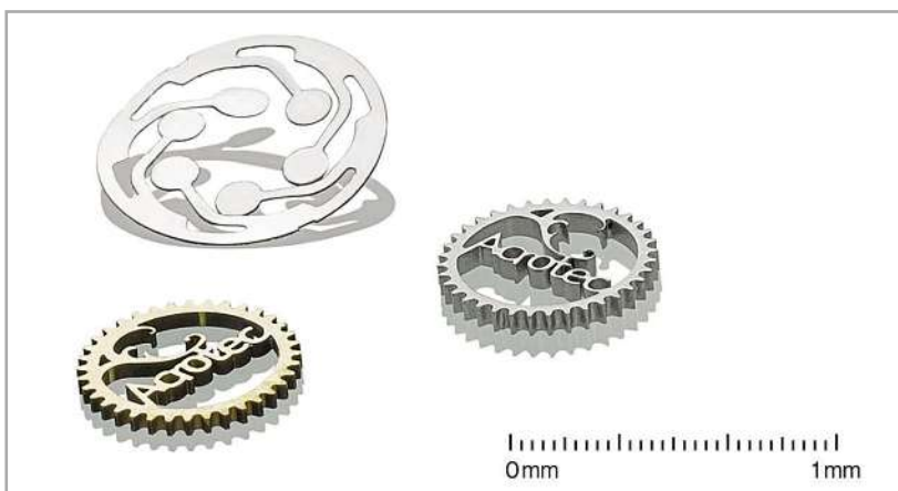
Micro-découpe de pièces en nitinol, tantale et carbure de tungstène réalisée avec la nouvelle technologie acquise par Microweld